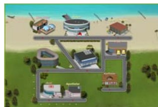
Plan a Holiday

Schauen Sie auf www.rehacom.de und verschaffen Sie sich einen Überblick über RehaCom und alle 39 Therapiemodule.