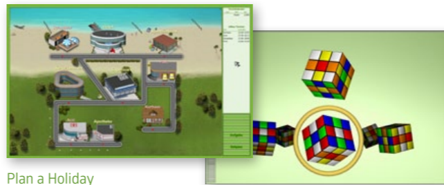
Plan a Holiday